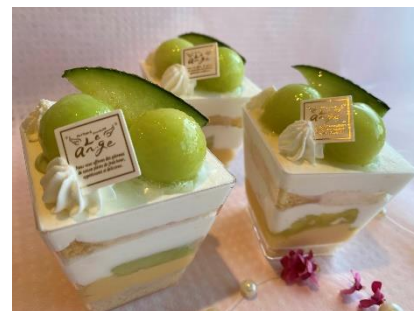
茨城県産メロンのショートケーキ