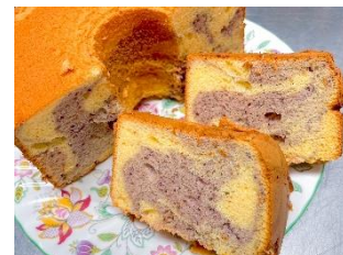
ブルーベリーシフォンケーキ