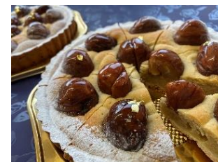
笠間市産和栗のタルト