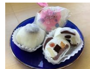
フルーツあんみつ大福