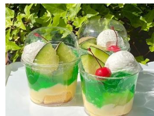
茨城メロンソーダパフェ